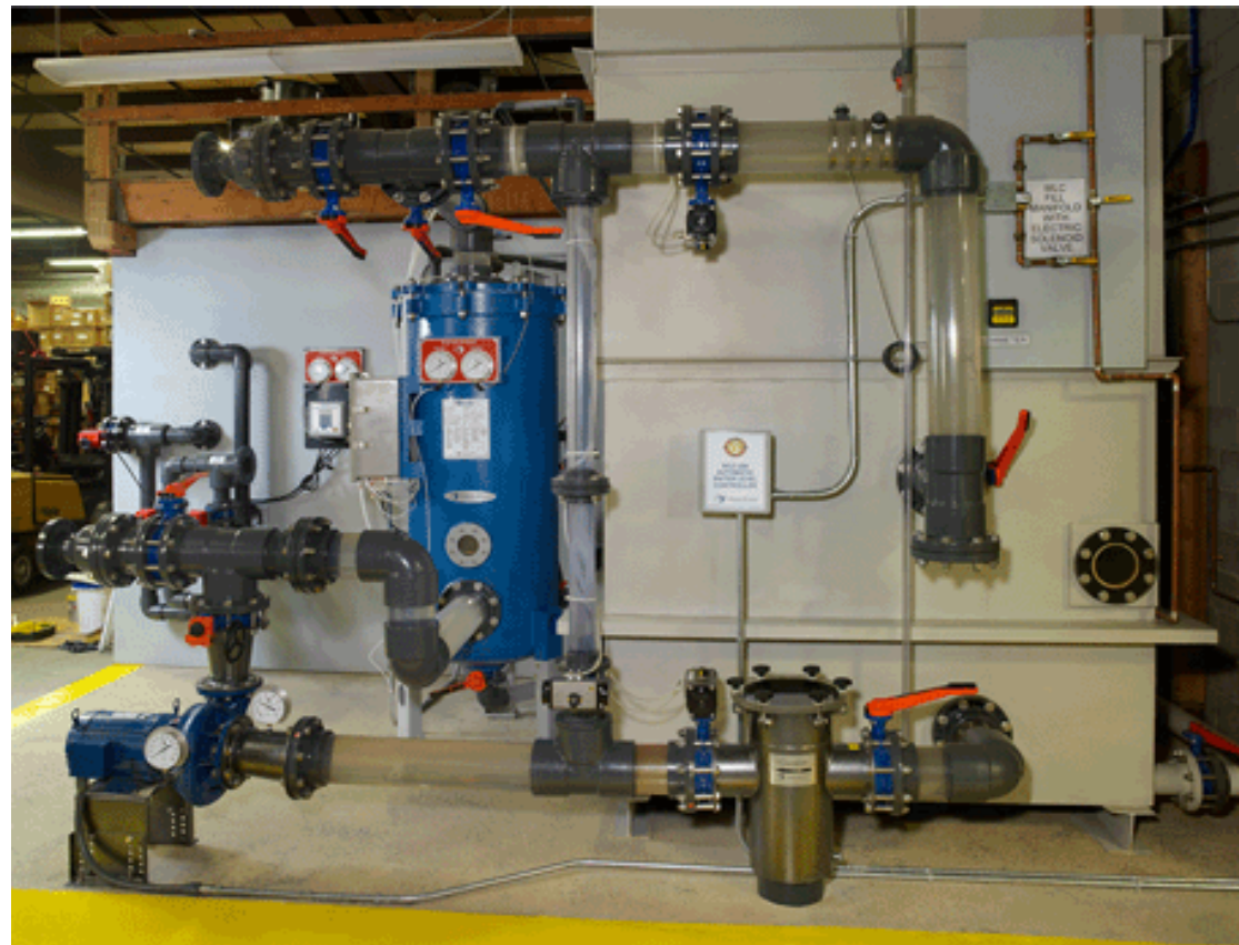
Neptune-Benson's Test Lab (front view)

Defender Filter erreichen höchste Wasserqualität